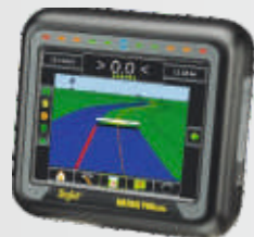
NAWIGACJA MATRIX PRO 570