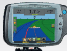
MATRIX 840 GS

Dla opryskiwaczy wyposażonych w sterowniki nie posiadające wbudowanych systemów GPS polecamy jeden z trzech monitorów Matrix: