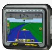
MATRIX 570 GS

Nawigacja Matrix 840 GS z ekranem 8,4 cala w jakości HD to zaawansowana systemowo a zarazem prosta w obsłudze nawigacja dla wymagających użytkowników. Daje ona poza podstawowymi funkcjami jakie powinna spełniać nawigacja możliwość np. podłączenia automatycznego wyłączania sekcji system BoomPilot, automatyczne wspomaganie kierowania system FieldPilot, moduł kompensacji pochyłu terenu czy też możliwość podłączenia 4 lub 8 kamer.